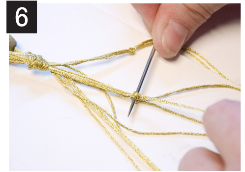
6- Prenez deux (2) ficelles et faites un nœud à 5 cm (2 po) du dernier nœud. Répétez pour les ficelles restantes. (Astuce : nous vous suggérons d'utiliser l'aiguille pour arrêter le nœud à la bonne mesure)