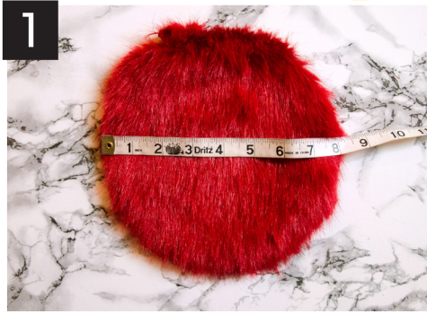
1- Coupez un cercle de 20 cm (8 ¼ po) de diamètre de fausse fourrure