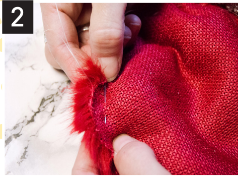
2- Faufilez, au fil de pêche, le contour du cercle à l'aide d'une aiguille