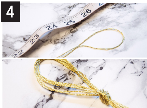
4- Couper six (6) ficelles de 132 cm (52 po), rassemblez-les, pliez-les en deux, puis faites un nœud.