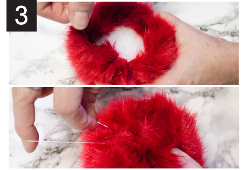
3- Déposez la boule de styromousse à l'intérieur du cercle de fausse fourrure, puis tirez sur le fil de pêche pour refermer le tout. Faites un nœud très serré dans le fil de pêche.